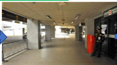
②10mほど直進します Walk straight around 10m ahead