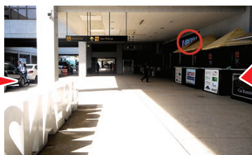
③ 10m ほど直進すると右側にセブインイレブンがあります Walk straight about 10m ahead, right side you can see 7 Eleven.