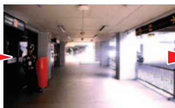
② 10m ほど直進します Walk straight around 10m ahead