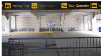
①国際線の出口を出ます From outside International arrival

In case arriving from Terminal2, please take a airport shuttle to Terminal1. Below information arriving in Terminal1.