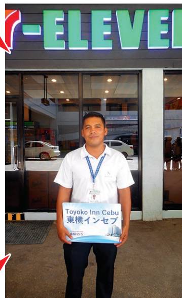
④ 運転手が待機しております W / our driver staff waiting in front of 7 Eleven.