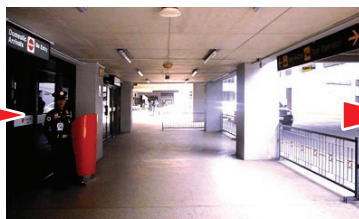
② 10m ほど直進します Walk straight around 10m ahead