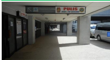
①国内線の出口を出て左へ進みます From outside Domestic arrival and turn left