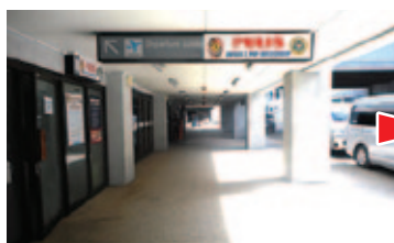
① 国内線の出口を出でて左へ進む From outside domestic arrival and turn left.