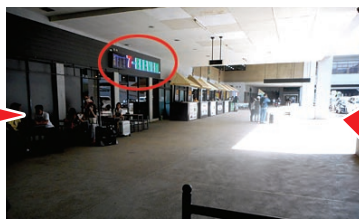
③ 左側にセブインイレブンです Left side you can see 7Eleven.