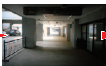
② 右へ進みます Turn right.