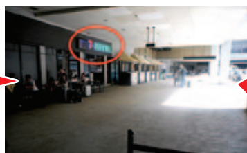
③ 左側にセブンイレブです Left side you can see Seven Eleven.