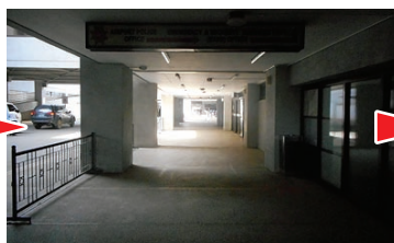
② 右へ進みます Turn right.