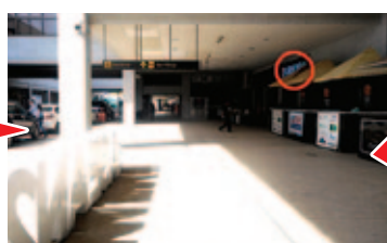
③ 10m ほど直進すると右側にセブンイレブがあります Walk straight about 10m ahead, right side you can see Seven Eleven.