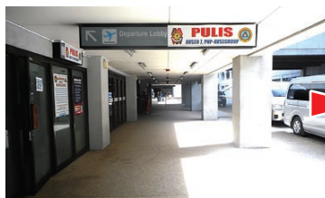
① 国内線の出口を出でて左へ進む From outside domestic arrival and turn left.