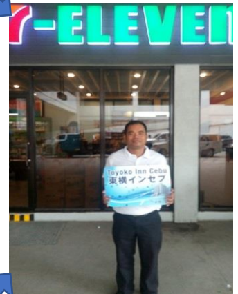
④スタッフが待機しております W/our staff waiting in front of SEVEN ELEVEN