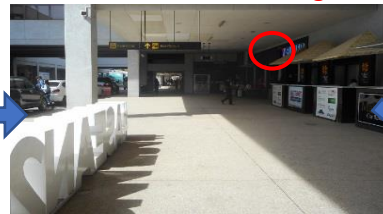
③10mほど直進すると右側にセブンイレブンがあります Walk straight about 10m ahead, right side you can see