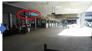
③左側にセブンイレブンです Left side you can see