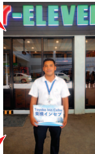
④ 運転手が待機しております W / our driver staff waiting in front of Seven Eleven.